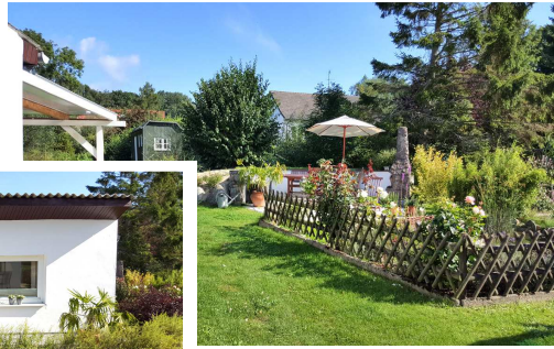
Garten & Gelände